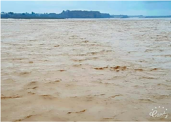
لینکرگا ته نردې د هلمند سیند (کب - ۱۹۹۶ل / ۲۰۱۷م)